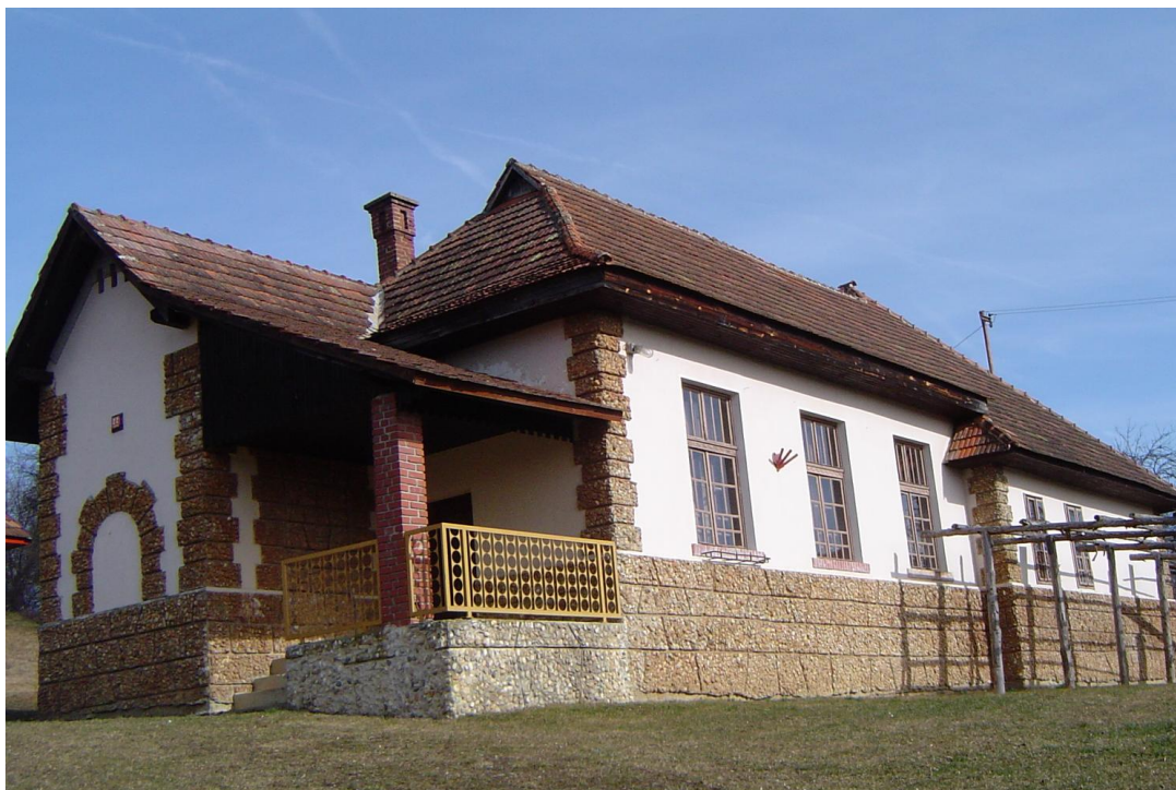
Stara šolska zgradba v Šulincih. 11

Mura je bila še naprej ločnica, ki je bila zares prava ovira za boljšo povezanost Prekmurja z matico. Na njej ni bilo potrebnih mostov. Funkcionirala je le povezava z brodi. Prekmurje, in še bolj Goričko, je bilo tako ujeto v ozki lok državnih meja z Avstrijo in Madžarsko, ki so sodelovanje navzven omejevale. To je eden od vzrokov, zakaj se je začetek razvoja zavlekel v sredino druge polovice 20. stoletja. Za primer nam lahko služi podatek, da razen dveh traktorjev, ki so jih nabavile zadruga okrog leta 1965, in tudi ta dva sta kmalu prenehala delovati, saj so zadruga vse po vrsti hitro propadale, so prvi, že izrabljeni in stari avstrijski traktorji na zasebna zemljišča začeli prihajati šele po letu 1970. Do tedaj so kmetje na severovzhodnem Goričkem, ki so svoja mala posestva uspeli obdržati v zasebni lasti v višini nad 90 %, obdelovali svojo zemljo z živinsko vprego; tako kot pred tristo in več leti.